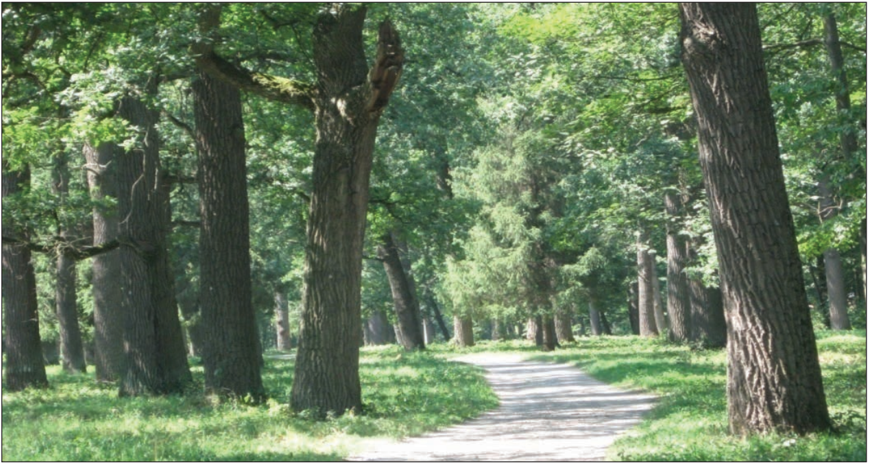
Рис. 1. Вікова діброва

ВКЛЕЙКА ДО СТАТТІ С.І. ГАЛКІН, Л.В. КАЛАШНІКОВА, Н.М. ДОЙКО, В.Л. РУБІС, Н.С. БОЙКО