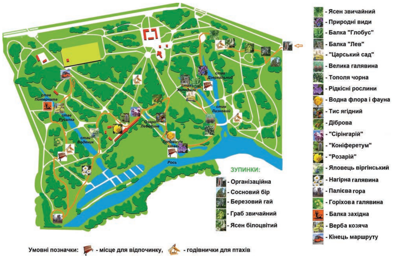
Рис. 10. Схема маршруту екологічної стежки дендропарку «Олександрія»