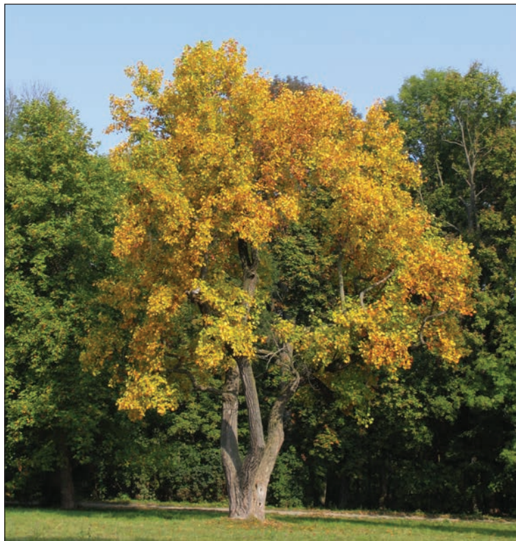
Puc. 6. Liriodendron tulipifera L.