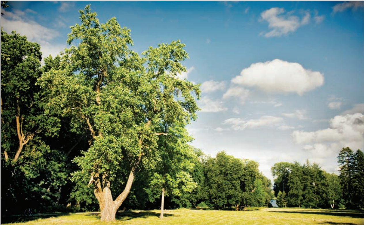
Рис. 3. Велика галявина