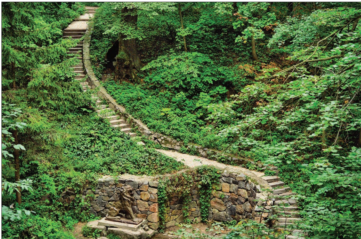
Рис. 8. «Джерело Лев»