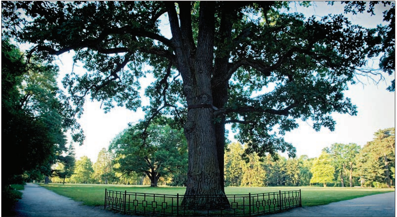
Puc. 5. Quercus robur L.