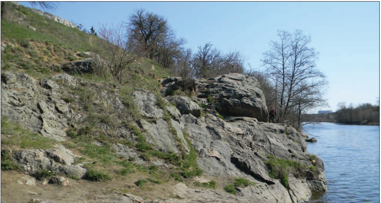
Рис. 2. Палієва гора