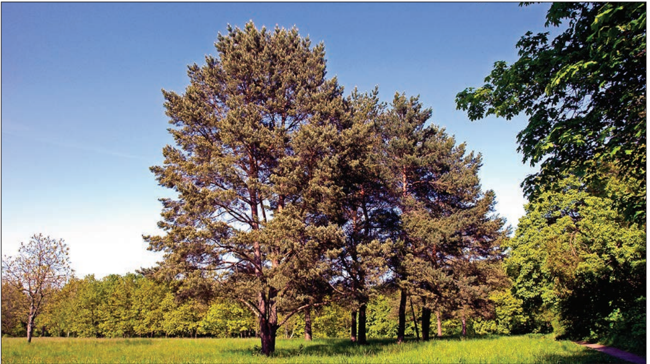
Рис. 4. Горіхова галявина