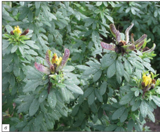
Puc. 7. a – Taxus baccata L.; б – Syringa josikaea Jacq.; в – Chamaecytisus podolicus (Blocki) Klaskova